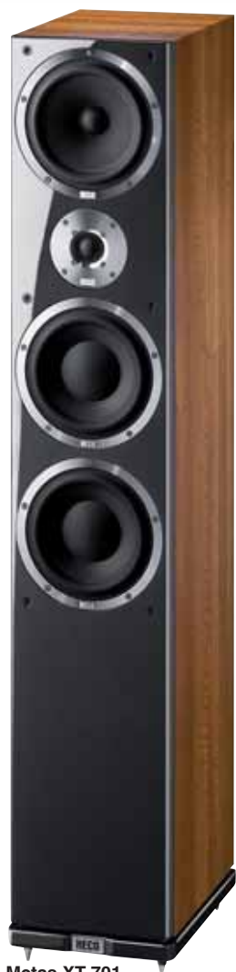
Metas XT 701