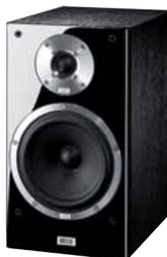
Metas XT 301