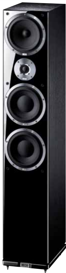
Metas XT 701