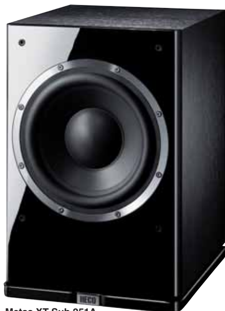
Metas XT Sub 251A