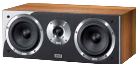
Metas XT Center 31