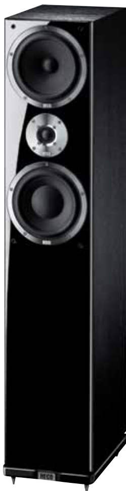
Metas XT 501