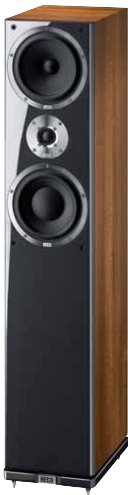
Metas XT 501