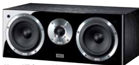
Metas XT Center 31