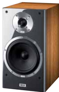
Metas XT 301