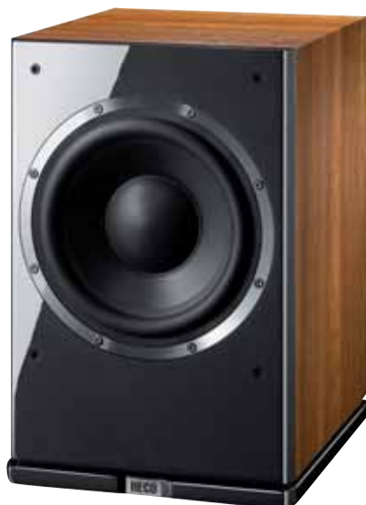
Metas XT Sub 251A