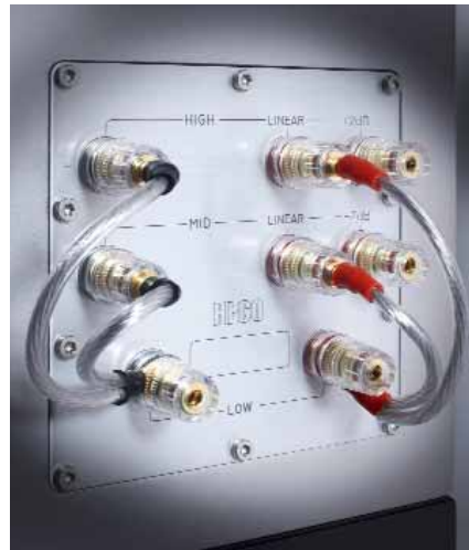
Das enorm große Anschlussfeld bietet die Möglichkeit zum Triamping bzw. Triwiring. Durch Umstecken der Kabelbrücken lässt sich der Mitteltonbereich um zwei Dezibel absenken, der Hochtöner um das gleiche Maß anheben.

Im Messlabor beeindruckt die Heco Statement mit einer sehr tiefen unteren Grenzfrequenz und einem insgesamt linearen Amplitudenverlauf bis über die höchste Messgrenze hinaus. Um 700 Hertz ist eine leichte Unregelmäßigkeit zu erkennen, die sich auch im Wasserfalldiagramm (nicht abgebildet) durch verzögerndes Ausschwingen widerspiegelt. Ab einer Frequenz von 1.500 Hertz sieht das Diagramm dagegen tadellos aus. Die Messungen offenbaren ebenfalls sehr niedrige Klirrwerte, vor allem der sich schnell unangenehm äußernde K3-Wert ist stets unterhalb von einem Prozent.